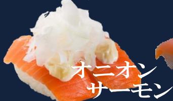
オニオンサーモン