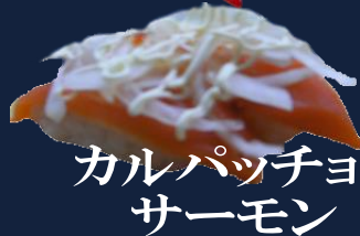
カルパッチョサーモン